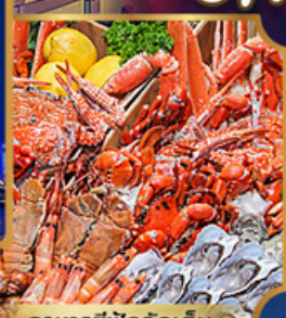
อาหารซีฟู้ดจัดเต็ม

บุฟเฟ่ต์เบียร์ไม่อั้น + ซีฟู้ด + บิงย่างเกาหลี