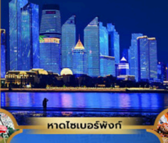
หาดโซเบอร์ฟังก์