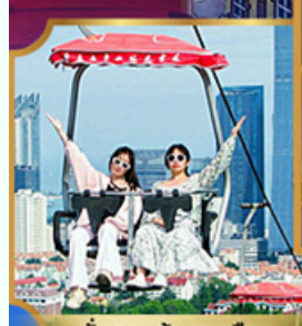
นั่งกระเช้า ชมเมือง