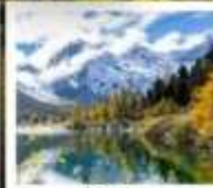
ปี้เพ็งโกว