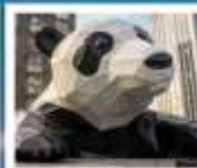
ห้าง IFS แพนด้าปิ่นตึก