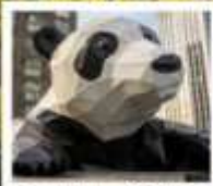
ห้าง IFS แพนด้าปิ่นตึก