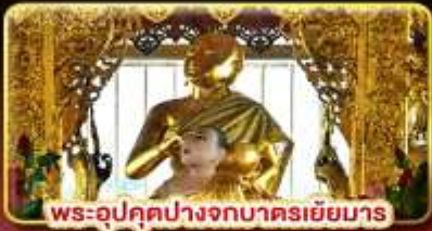
พระอุบลคุปปางจกบาตริเยียมาร