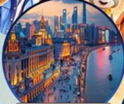
หาดไวทาน