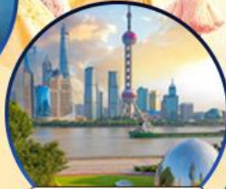
นอร์ทปิ่น กรีนแลนด์