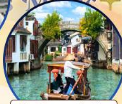
เมืองโบราณจูเจียเจีย