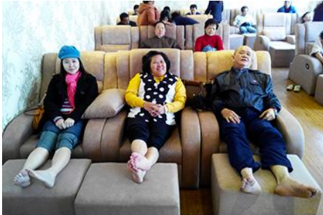
ศูนย์วิจัยแพทย์แผนจีน