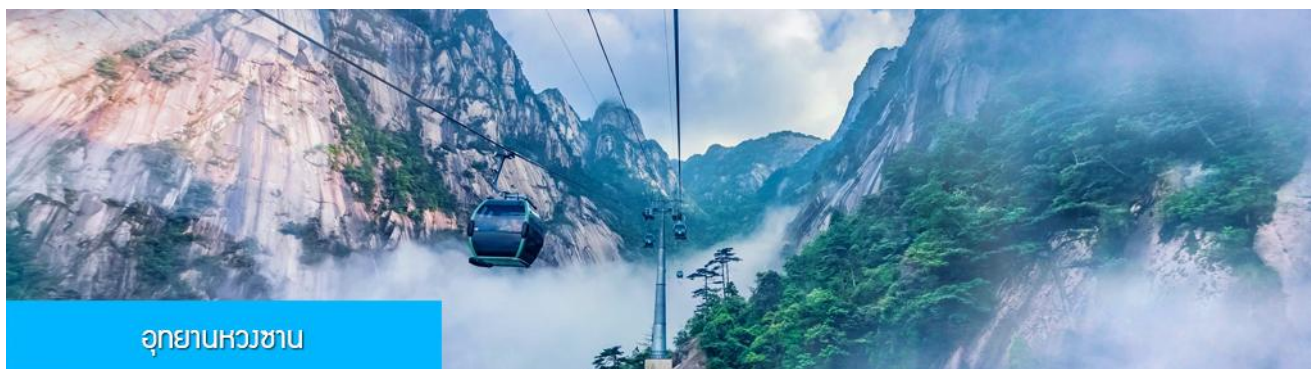
อุทยานหวงซาน