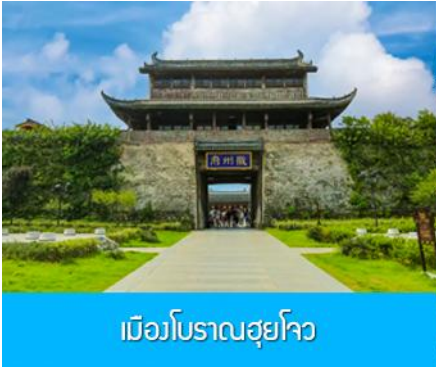
เมืองโบราณฮุยโจว