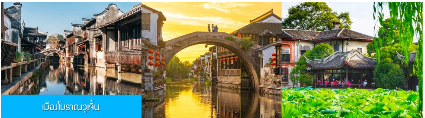
เมืองโบราณวูเจิน