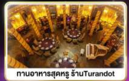
ทานอาหารสุดหรู ร้านTurandot