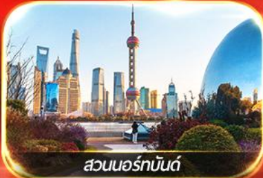
สวนนอร์มันด์