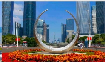
จัตุรัสฮัวเจิง

*ทางบริษัทฯ ขอสงวนสิทธิ์ในการสลับโปรแกรมทัวร์ตามความเหมาะสมขึ้นอยู่กับสถานการณ์หน้างาน โดยคำนึงถึงผลประโยชน์ของลูกค้าเป็นสำคัญ