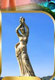
จูไห่ฟิชเชอร์ทิสรา