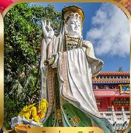
เจ้าแม่กวนอิม พลัสเบย์