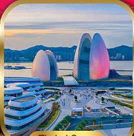
Zhuhai Opera House