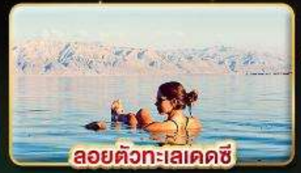
ลอยตัวทะเลเดคซี