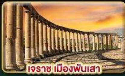
เระซ เมืองพันเสา