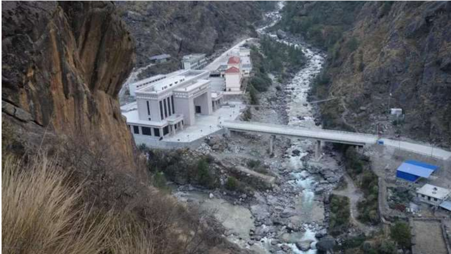
ถึง ด่านพรมแดน พาท่านเดินทางตรวจคนเข้าเมืองโดยการเข้าเนปาลสำหรับคนไทยต้องใช้วีซ่า