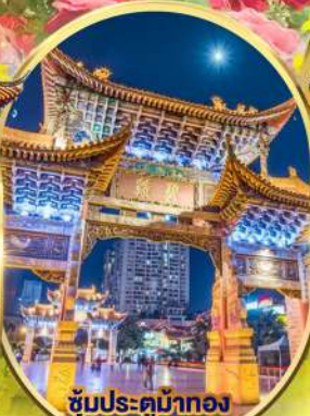
ซุ้มประตูม้าทอง และ ซุ้มประตูไถ่บรกด