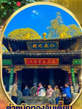
ตำหนักทองจินเตียน