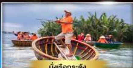
นั่งเรือระดิง