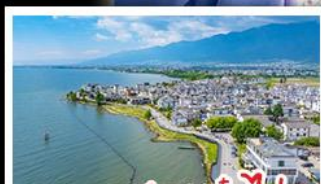
ทะเลสาบเอ้อไห่