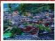
หมู่บ้านแม่วชิเจียง