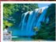
น้ำตกหวงกั๋วซู