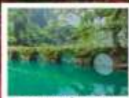
อุทยานเสี่ยวซีหลง