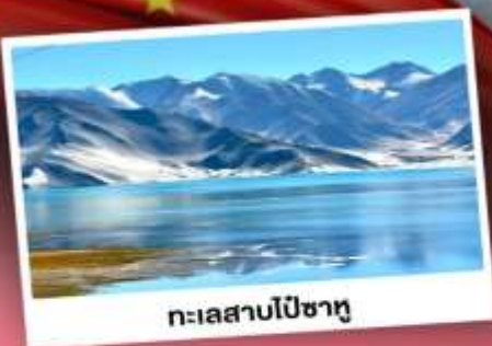
ทะเลสาบไปซาทุ

เปิดประตูสู่อารยธรรมพันปีแห่งซินเจียงใต้ ชมความสวยงามของหมู่บ้านดอกแอปเปิ้ล