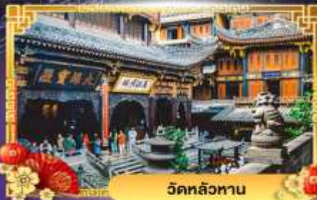
วัดหลัวหนาน