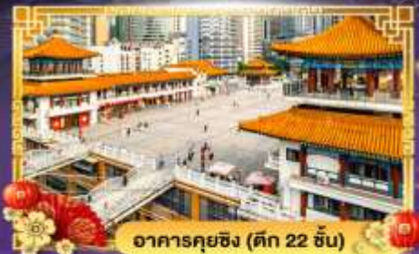
อาคารคุยซิง (ตึก 22 ชั้น)