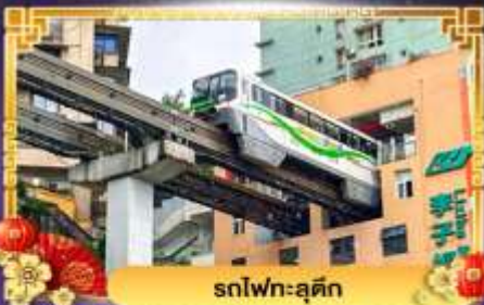
รถไฟฟ้า-ลู่ตัก