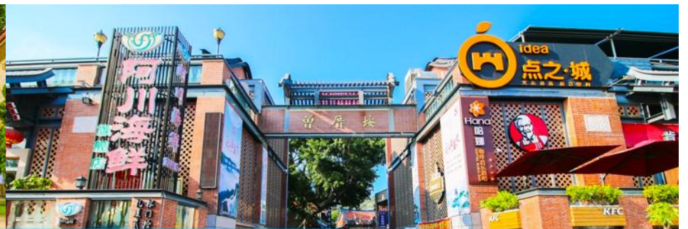
หมู่บ้านชาวประมง เจิงจ้าวอัน