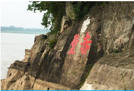
สมรภูมิมหาแดง

พักที่ CHIBI HOTEL โรงแรมระดับ ดาวท้องถิ่นในเมืองชือปี้