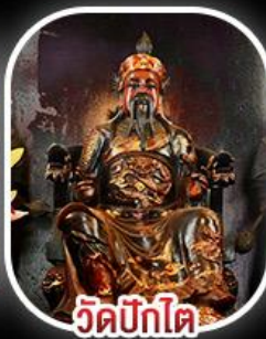
วัดบิกิต