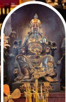
วัดปักไต้ เสริมโชคกลางนำความรุ่งเรืองทุกด้านของชีวิต