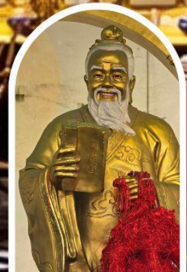
วัดหวังต้าเซียน ขอพรสุขภาพ ความรัก