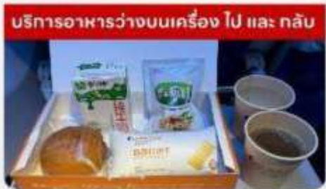
บริการอาหารว่างบนเครื่องบิน ไป และ กลับ