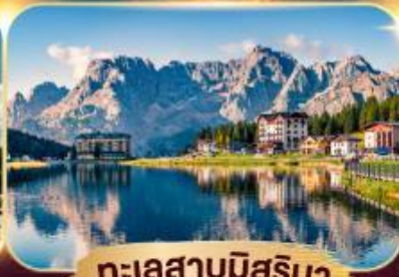
ทะเลสาบมิสุรีนา