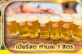
เบียร์สด ท่านละ 1 สิตร