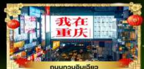
ถนนทวงจิมเฉียว