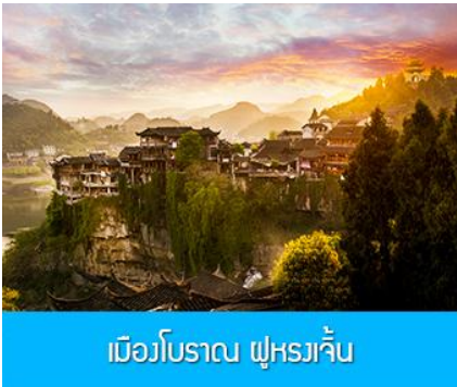
เมืองโบราณ ฟุหยงเจิ้น