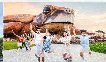
วินเพิร์ล อควาเรียม

*ทางบริษัทฯ ขอสงวนสิทธิ์ในการสลับโปรแกรมทัวร์ตามความเหมาะสมขึ้นอยู่กับสถานการณ์หน้างาน โดยคำนึงถึงผลประโยชน์ของลูกค้าเป็นสำคัญ