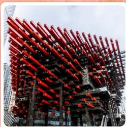
ตึกตะเกียบ