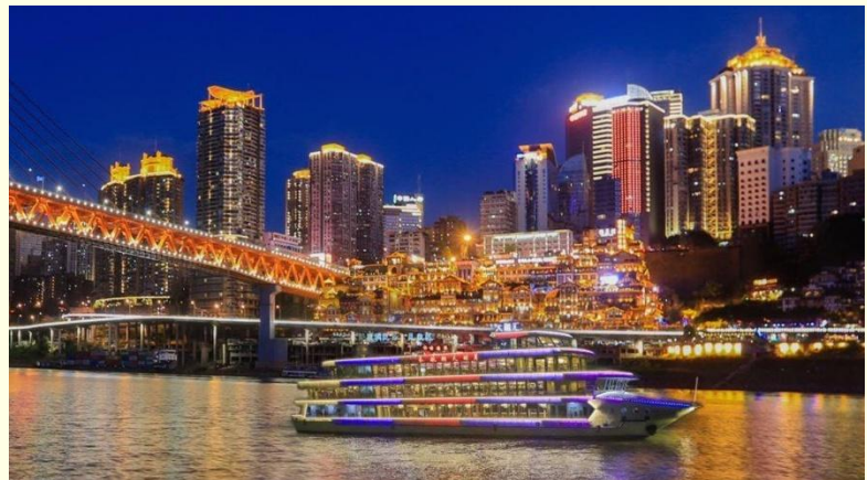
Option เสริม ล่องเรือราตรีชมแม่น้ำสองสาย

*ราคาทัวร์นี้ยังไม่รวมค่าบริการค่าล่องเรือ สำหรับท่านที่สนใจจะมีค่าบริการท่านละ 300 หยวน (ราคาอาจมีการเปลี่ยนแปลง กรุณาตรวจสอบราคาก่อนซื้ออีกครั้ง)*