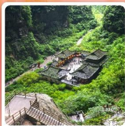
หลุมบ่อฟ้า