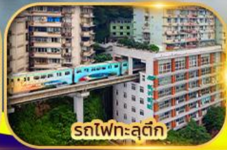
รถไฟทะลุตึก