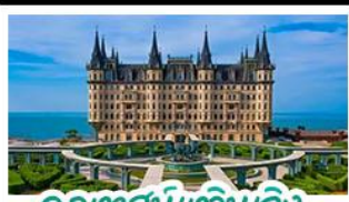
ฤดูหิมะเหนือเมือง

เมืองท่าชิงเต่า - ฤดูหิมะเหนือเมือง เบียร์ชิงเต่า + อาหารทะเล สตรีทอาร์ต สตูดิโอจิบลิ