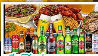
เบียร์ชิงเต่า + อาหารทะเล