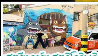
สตรีทอาร์ต สตูดิโอจิบลิ