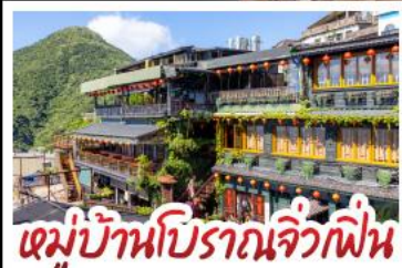
หมู่บ้านปิศาจจิ้งจิก