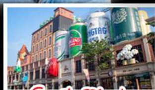
โรงเบียร์ชิงเต่า