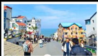
ถนนคอปเพิลิงหมายเลข 8

สัมผัสความยิ่งใหญ่ของ 4 เมืองสำคัญ ชิงเต่า - เยียนโก - เฟิงไห่ - เว่ยไห่ ปาต้ากวน - โบสถ์คาทอลิก - ตึกเก่าริมหา