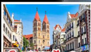
โบสถ์เซนต์ไมเคิล