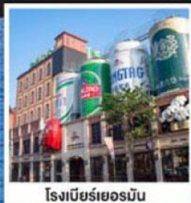
โรงเบียร์เยอรมัน