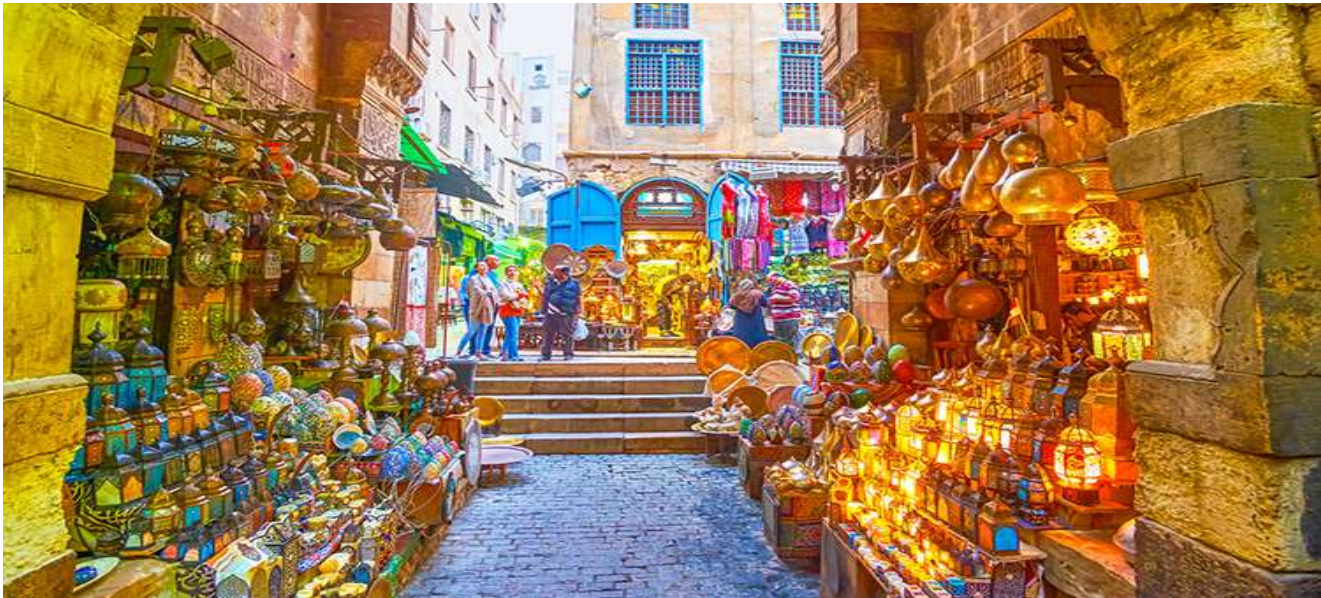
นำท่านออกเดินทางสู่สนามบินไคโร