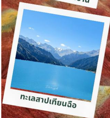
ทะเลสาบเทียนฉือ