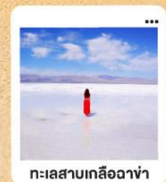
ทะเลสาบเกลือฉาซ่า