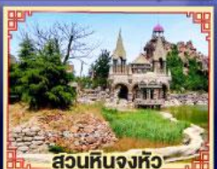
สวนหินจงหิว