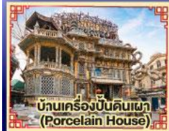
บ้านเครื่องปั้นดินเผา (Porcelain House)