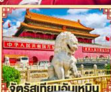
จัตุรัสเทียนจันเหมิน