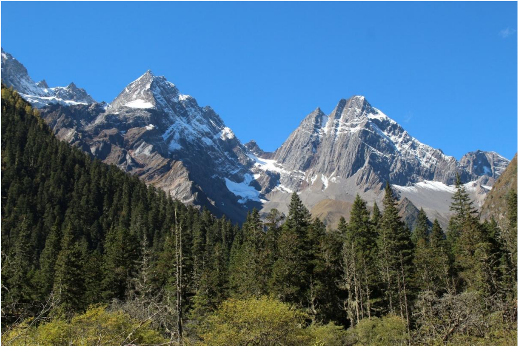
ฤดูใบไม้ผลิ (SPRING)