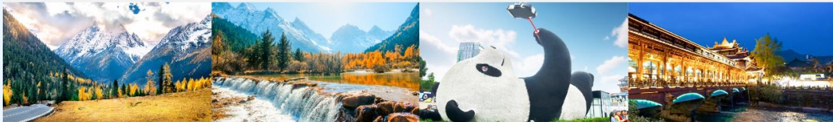
ภูเขาสีดรุณี (หุบเขาชวงเจียวโกว)