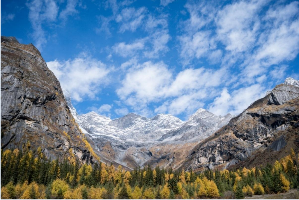
ฤดูใบไม้ร่วง (AUTUMN)

นำท่านเที่ยวชม หุบเขาซวงเฉียวโกว (Shuangqiao Valley) เป็นจุดวิวทิวทัศน์ที่สวยงามที่สุด ชมความงามธรรมชาติของซวงเฉียวโกว (ลำน้ำสองสะพาน) ธารน้ำมีความยาว 35 กิโลเมตร มีทิวทัศน์ของภูเขาเป็นหลัก ลำธารผ่านจุดต่างๆที่เป็นจุดทิวทัศน์ ไม่ว่าจะเป็น ซานกั้วจวง, เขาหนิวซิน, เย่เหรินเฟิง ถือเป็นจุดท่องเที่ยวแห่งหนึ่งของเขาสีตฤณี ที่รวบรวมจุดสำคัญหลายๆอย่างเข้าด้วยกันไว้ ชมไฮไลท์จุดชมวิวได้แก่ ชมหุบเขาหินหยาง หุบตันหยาง แล้วเดินทางเข้าสู่ส่วนลึกสุด ท่านจะได้เห็นธารน้ำแข็ง ภูเขากระจกแก้ว ภูเขาดวงอาทิตย์ ภูเขาดวงจันทร์ ยอดเขากระต่าย ทะเลสาบ และทุ่งหญ้าเหนียนหญูป้า (รวมรถประจำทางในอุทยาน)