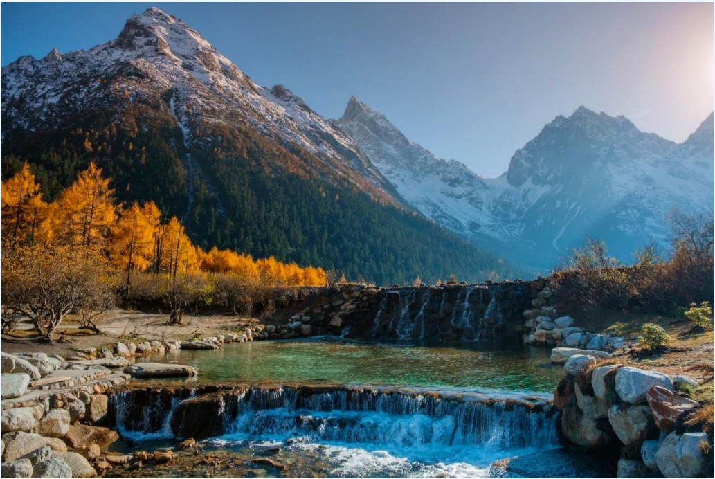
ฤดูใบไม้ร่วง (AUTUMN)