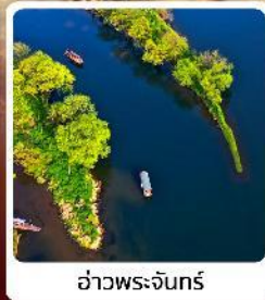
อ่าวพระจันทร์