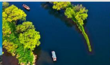
อ่าวพระจันทร์