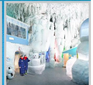
"KAMIKAWA ICE PAVILLION"