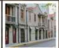
แลนด์มาร์กจากหยวน