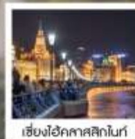
เซี่ยงไฮ้คาสสิกไนท์