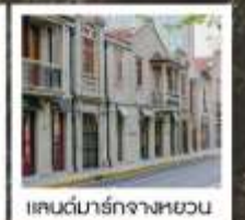
แลนด์มาร์กจางหยวน

เซี่ยงไฮ้ คาสสิก ไนท์ / 3 ดึกใหญ่แห่งเซี่ยงไฮ้ คองเรือหมู่บ้านโบราณจูเจียเจียว / EKA Tianwu / วัดหลงหัว แลนด์มาร์ก จางหยวน / ถนนหวยไห่ / ชมโชว์ ERA ที่โรงละครโด่งดังระดับโลก / ซินเทียนตี้