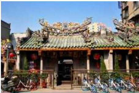
ศาลเจ้าแม่ทับทิม

พักที่ โรงแรม Kyriad Marvelous HOTEL 4* หรือเทียบเท่าในซัวเถา