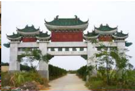
สุสานพระเจ้าตากสิน