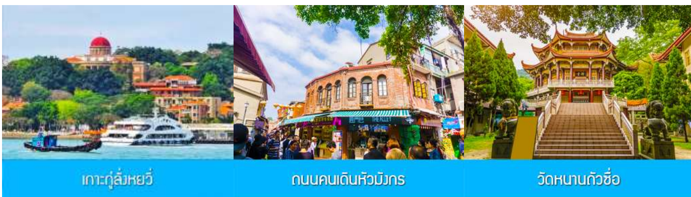
เกาะกู่ลิ่งหยวี

พักที่ โรงแรม XIAMEN HENGLONG HOTEL 4* หรือเทียบเท่าในเซี่ยเหมิน