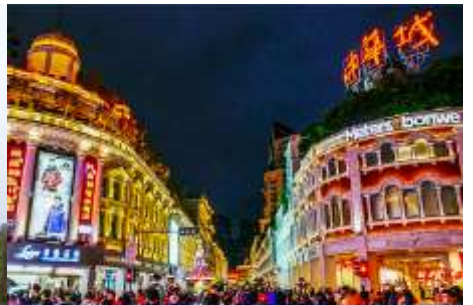
ถนนคนเดิน จวซาลู่