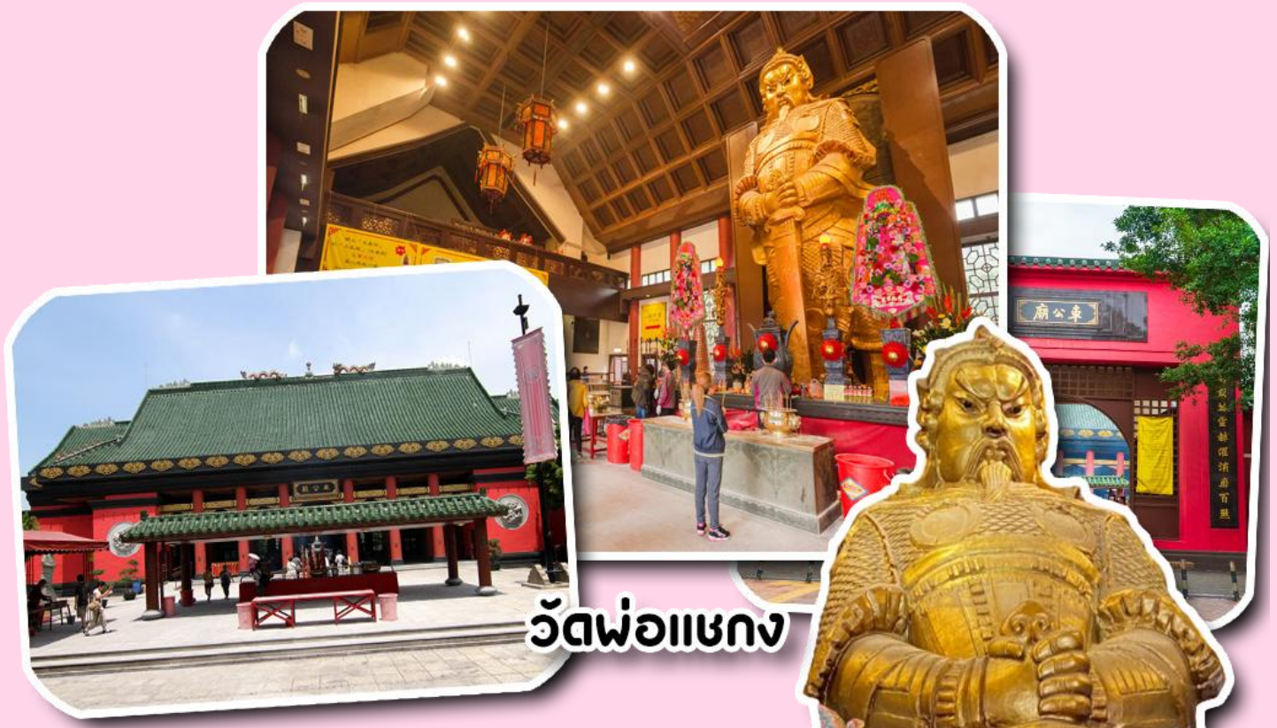
วัดพ่อແຂງ

หลังจากนั้น พาท่านช้อปปิ้งอิสระ ย่านจิมซาจู้ (tsim sha tsui) เป็นย่านช้อปปิ้งชื่อดังของเกาะฮ่องกง ที่คนไทยทั่ว ๆ ไปก็ต้องรู้จัก และพูดกันหนาหูติดปากมานาน ตั้งอยู่บริเวณริมอ่าววิคทอเรีย ของฝั่งเกาลูน ฮ่องกง เมื่อพูดถึงจิมซาจู้ ทุกคนก็ต้องนึกถึง ถนนนาธาน ซึ่งทอดยาวตั้งแต่จิมซาจู้ไปจนถึงย่านปรีนซ์ เอ็ดเวิร์ด นับเป็นถนนสายช้อปปิ้งอย่างแท้จริง และเป็นเสน่ห์อย่างหนึ่งของฮ่องกง ที่ทั้งสองฟากฝั่งของถนน จะเต็มไปด้วยร้านค้าต่างๆ มากมาย ทั้งเสื้อผ้าแบรนด์เนมชื่อดังทั่วโลก เครื่องหนังชั้นดี ห้างสรรพสินค้าทันสมัย ร้านอาหารและภัตตาคารสุดหรู โรงแรมตั้งแต่ระดับเกสต์เฮ้าส์ไปจนถึงระดับ 5 ดาว