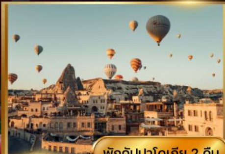
พิกคิปปาโดเกีย 2 คืน