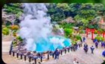
บ่อยูมิจิโตะ