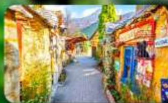
หมู่บ้านยูฟุอิน