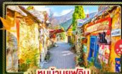
🏠 หมู่บ้านญี่ปุ่น