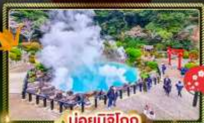
♨️ บ่อน้ำพุร้อน