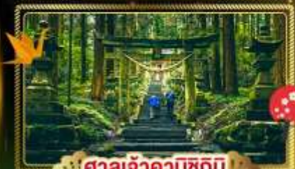
🏯 ศาลเจ้าคามิชิคิมิ