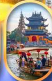
เมืองโบราณจู่เจียเจียว