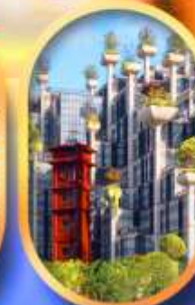
อาคาร 1,000 คัดไม้