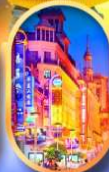
ถนนหนานกิง