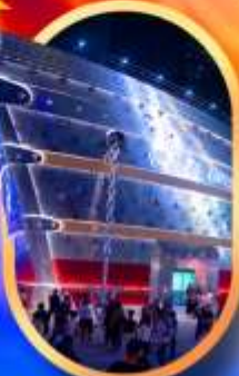
เรือคอะหลุยส์