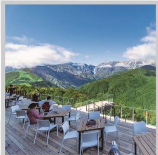
“HAKUBA MOUNTAIN HARBOR”

นำท่านไปโอบกอดธรรมชาติที่ครบครันในที่เดียว “คามิโคจิ” สวิสเซอร์แลนด์แดนญี่ปุ่นเทือกเขาที่ปกคลุมด้วยหิมะสวยงาม ชมความงามของ “ทุ่งพืชมอส ฟุจิชิบะซากุระ” มนต์เสน่ห์..พรมธรรมชาติสีชมพูหลากสีสดใส เปลี่ยนอริยาบท “ขึ้นกระเช้าฮาคุบะ อิวะตะเกะ” เพื่อชมวิวพาโนรามาของเทือกเขาแอลป์ญี่ปุ่นกันให้อิ่มใจ สัมผัสกลิ่นอายเมืองเก่า “เมืองทาคายามา” ที่ยังคงอนุรักษ์ความเป็นอยู่ เมื่อสมัยเอโดะกว่า 300 ปี สายช้อปปิ้งห้ามพลาด “คารุอิซาวะ เอ้าท์เล็ต” แลนด์มาร์กของเมืองคารุอิซาวะ และ “ย่านชินจุกุ” แห่งเมืองโตเกียว ชมความงามกับเส้นทาง “เจแปนแอลป์ (ท่าแพงหิมะ)” สุดยอดของการท่องเที่ยวที่ถูกขนานนามว่า “หลังคาแห่งญี่ปุ่น”