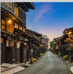
“TAKAYAMA OLD TOWN”