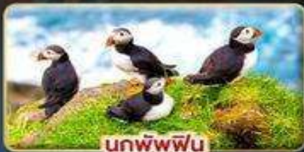
นกพิฟฟิน

📅 เดินทาง : 30 เม.ย. - 07 พ.ค. | 23-30 ก.ค. 69