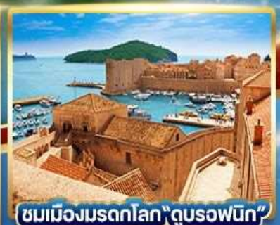
ชมเมืองมรดกโลก "ดูบรอฟนิก"