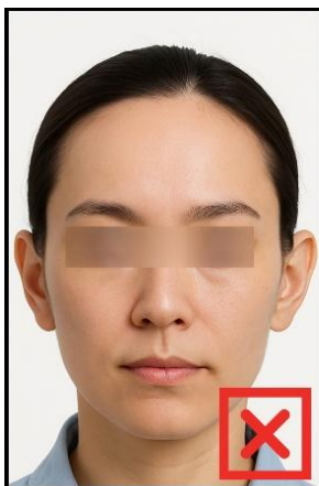
รูปที่ไม่ได้ขนาด ตามที่สถานทูตกำหนด