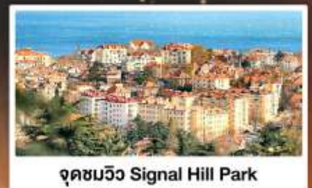
จุดชมวิว Signal Hill Park