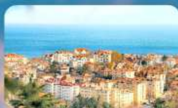
จุดชมวิว Signal Hill Park