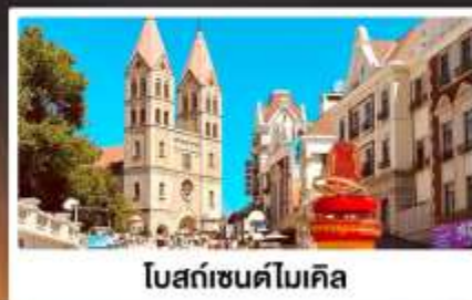
โบสถ์เซนต์ไมเคิล